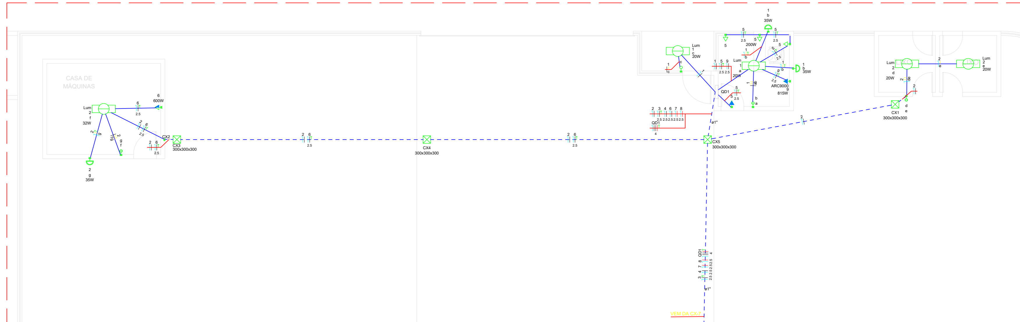
PLANTA BAIXA - GUARITA/ LIXEIRA/ CASA DE MÁQUINAS ESC. 1:75